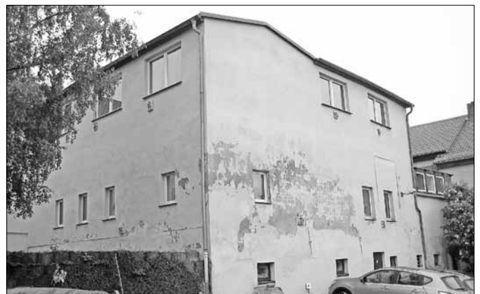
Ansicht Hintergebäude Am Graben 5 - 7

Die Abrissarbeiten sollen in der 24. KW beginnen und in der 26. KW abgeschlossen sein. Hinsichtlich einer erforderlichen Sanierung der sich mit der Rückbaumaßnahme aufzeigenden Gebäuderückfront werden im nächsten Zeitraum weitere Bauleistungen zeitnah ausgeschrieben.