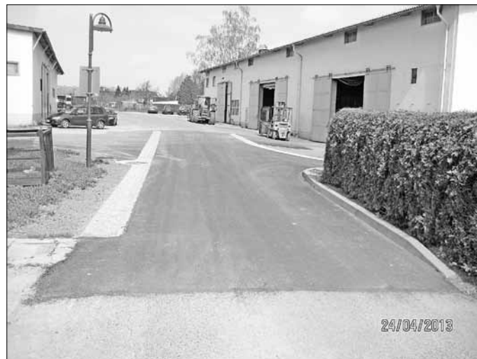
Sanierter Straßenbereich der Scheibemühlenstraße

Ende April wurde die Maßnahme Instandsetzung der Scheibemühlenstraße (Höhe Grundstück Nr. 15) im Ortsteil Heeselicht und die Maßnahme Instandsetzung der Straßenentwässerung vor dem Grundstück Carl-Samuel-Senff-Straße 4 in Stolpen abgeschlossen.