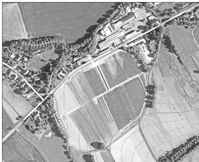
Die Hussitenschanze von oben im Jahre 2001

„Die Altstadt-Helmsdorfer Schanze ist keineswegs von den Hussiten angelegt worden, sondern viele Jahrhunderte älter. ... Jedenfalls haben wir in ihr einen altlawischen Ringwall vor uns, der als Kulturstätte wie als Versammlungsplatz und Verteidigungsanlage diente. Die Hussiten haben den festen Platz für ihre Zwecke bereits vorgefunden und ihn nur noch verstärkt und vergrößert. Das befestigte Lager mag 1429 einen Durchmesser von fast 500 Meter und einen Umfang von 1,5 Kilometer gehabt haben.“