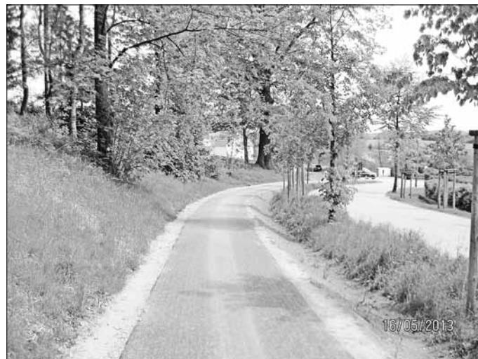
Ansicht fertig gestellter Gehwegbereich

Mitte Mai 2013 wurden die Bauarbeiten im Bereich des Fußweges an der Bahnhofstraße abgeschlossen. Wie bereits in der Maiausgabe des Anzeigers informiert, soll die Straßenbeleuchtung entlang des Gehweges in diesem Jahr noch mit erneuert werden. Derzeit laufen in diesbezüglicher Hinsicht noch die Abstimmungen zwischen dem Bauamt und dem Ortschaftsrat Stolpen zu Leuchtentyp und Leuchtmittel, die eingesetzt werden sollen. Im Ergebnis soll ein Fördermittelantrag über die SAB Sachsen gestellt werden. Der Aufbau der neuen Straßenbeleuchtung ist für 3./4. Quartal 2013 angedacht.