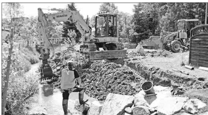
Uferinstandsetzungsarbeiten bei Grundstück Hauptstraße 77

Nach dem Ende der Fischschonzeit konnten Anfang Mai 2013 die Baumaßnahmen zur Hochwasserschadensbeseitigung am Langenwolmsdorfer Bach fortgesetzt werden. So wurde zum Beispiel der durch das Hochwasser stark geschädigte Uferabschnitt im Bereich von Grundstück Hauptstraße 77 in Langenwolmsdorf wieder in Stand gesetzt.